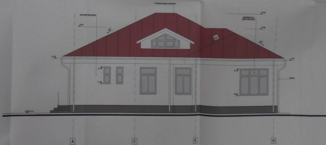
FATADA LATERALA DREAPTA