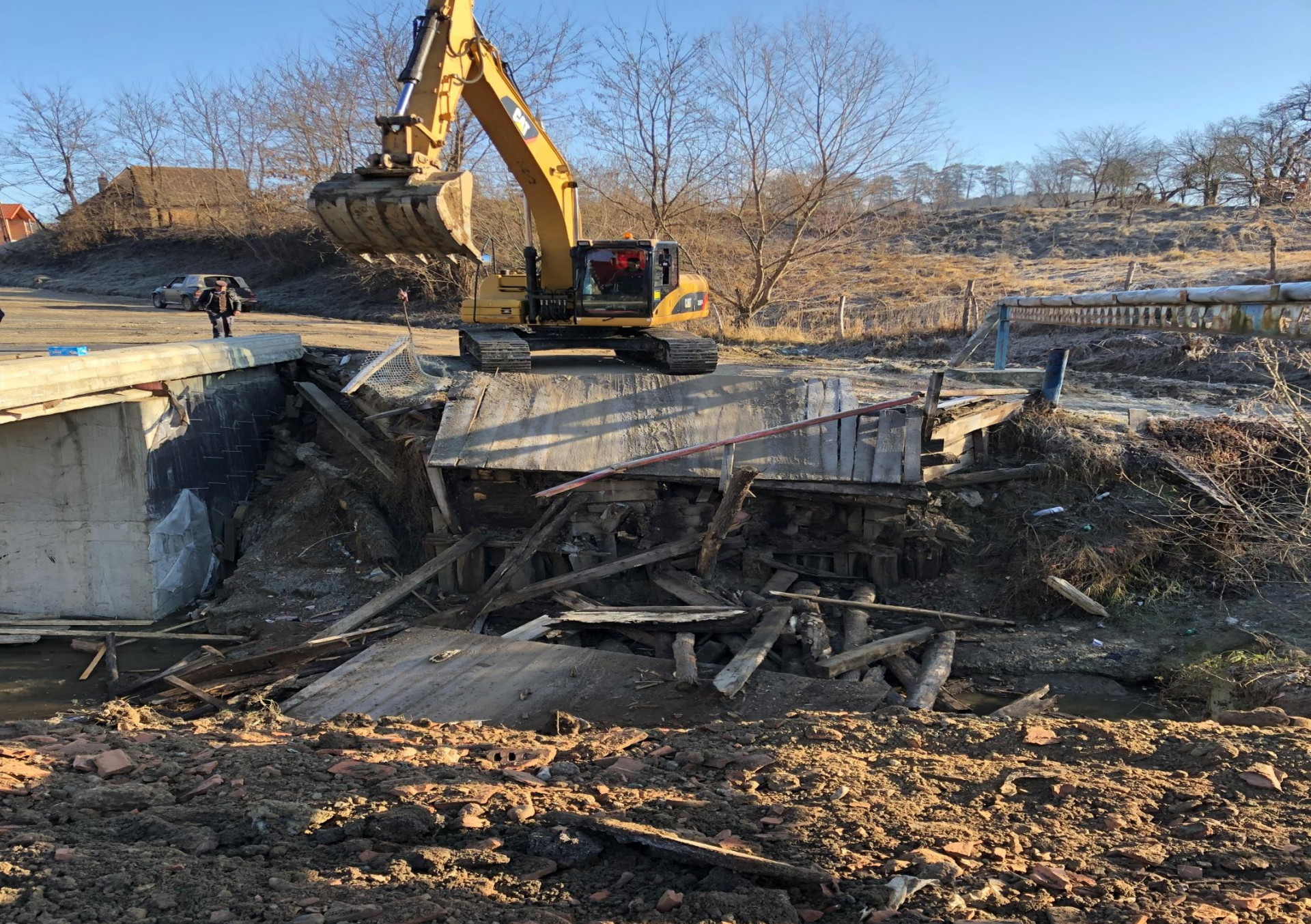
Demolarea Podului vechi