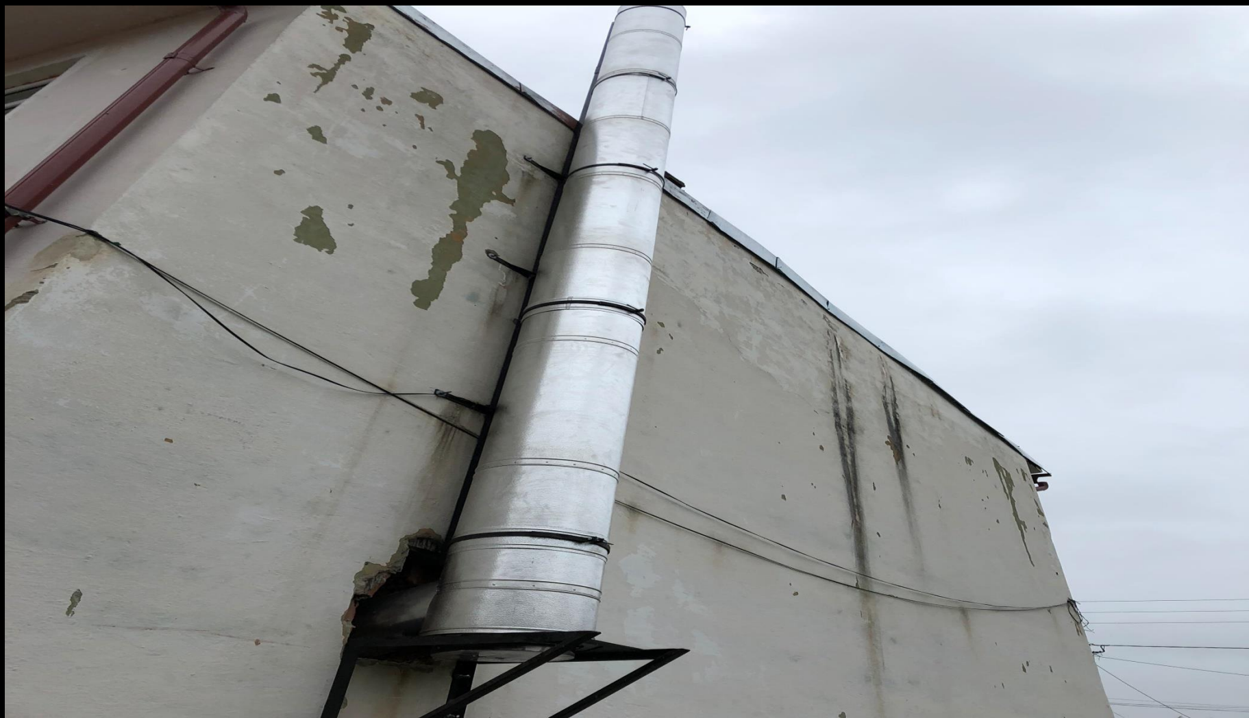
Cos centrala termica Apold