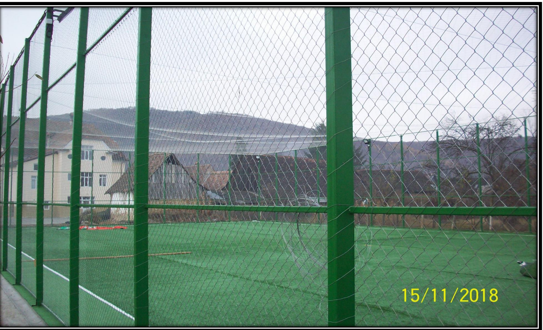
Teren de sport din satul SAES